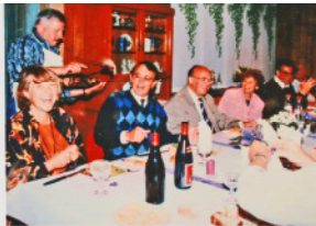
2009 70 Jahre Flamingo

Spätestens jetzt war klar, dass die Regelmässigkeit der Einladungen System hatte. Flamingo feierte mit uns wieder einen „Runden“, den 70-igsten. Das Team, das sich bereits früher bewährt hatte, war wieder im Einsatz. Blitz als umsichtige Gastgeberin, Bantam am Grill und Flamingo als Mundschenk. Im schönen Garten genossen wir den Apero. Zum Essen war wieder im festlich geschmückten Wohnzimmer aufgedeckt. Ein toller Abend, danke Flamingo und Blitz.