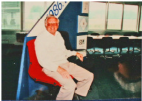
1989 50 Jahre Flamingo

Grillparty bei Flamingo und Blitz zum Dritten.