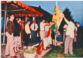
1999 60 Jahre Flamingo